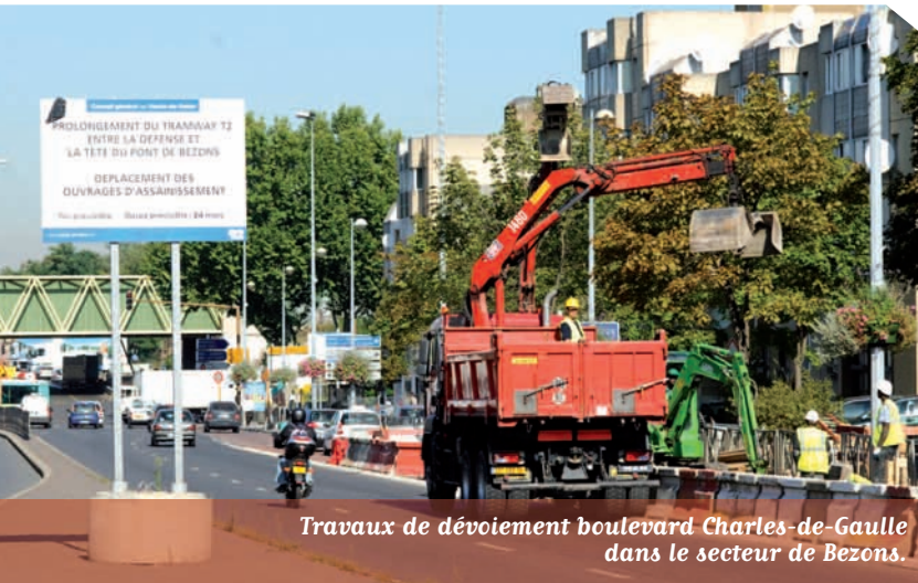
Travaux de déviation boulevard Charles-de-Gaulle dans le secteur de Bezons.