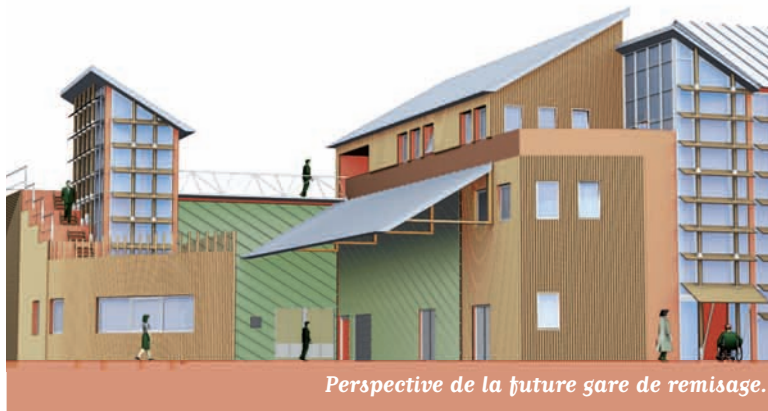
Perspective de la future gare de remisage.

Qu'est-ce qu'un site propre ? Tout simplement, une ligne de bus ou de tramway circulant en site protégé par rapport à la circulation automobile. Le parcours ainsi matérialisé permet d'assurer la priorité aux